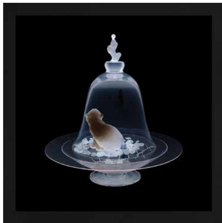
Foto incorniciata (fronte e retro) positiva e negativa. Stampa giclée su carta cotone Hahnemuhle, cornice in legno e vetro museale. Certificata, firmata e numerata.