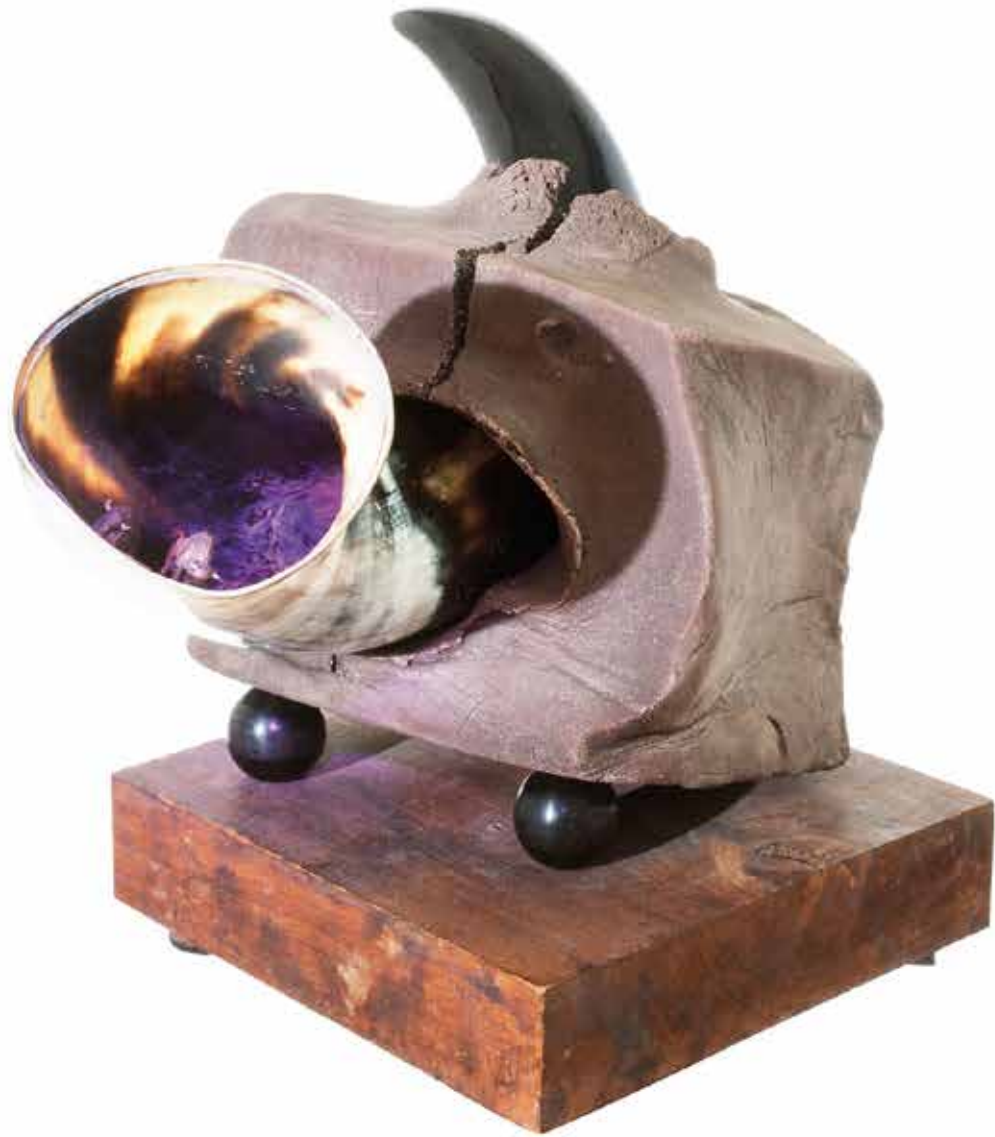
DM/04282/2010 - Da Altamira in poi tutto è decadenza (Pablo Picasso)