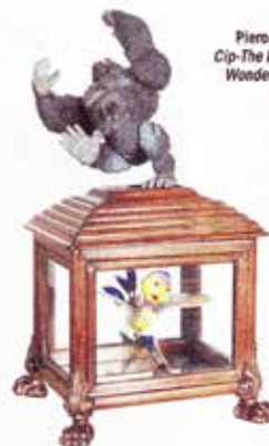
Piero Livio, Cip-The Eighth Wonder Sija , 2017

MAISON EUROPÉENNE DE LA PHOTOGRAPHIE 5-7, rue de Fourcy (IV e ) JUSQU'AU 7 janv.